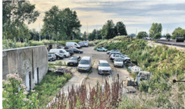
De auto's gaan onder de grond in de nieuwe plannen.