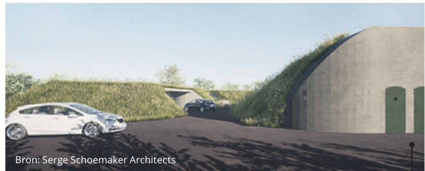
Impressies van ingang garage, gezien vanuit woonhuizen aan overzijde fort.

De Liefde: "Ik wil iedereen oproepen om te stemmen op Zeilfort Kudelstaart. Spoor je burens en vrienden aan om hetzelfde te doen! Zodat Kudelstaart in heel Nederland bekend wordt. En er geen twijfel meer kan zijn over de breed gedragen steun voor Zeilfort Kudelstaart. Laten we op 2 september tijdens Vuur en Licht vieren dat we het mooiste fort zijn!"